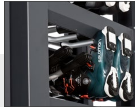
Horizontale Anordnung der Boots für optimale Platzausnutzung